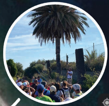
Il "Viale delle Palme"